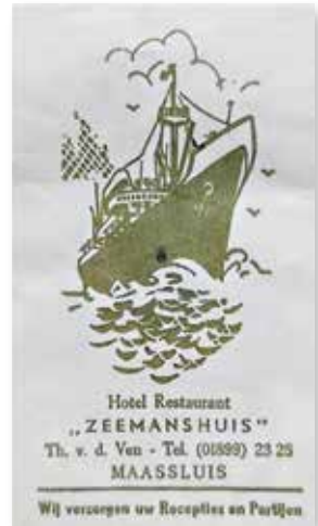
Suikerzakje van het Zeemanshuis.