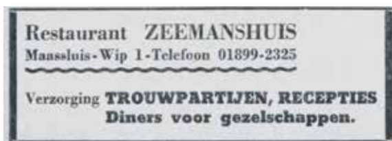
Advertenties in de Maassluische Courant Restaurant Zeemanshuis anno 1959.