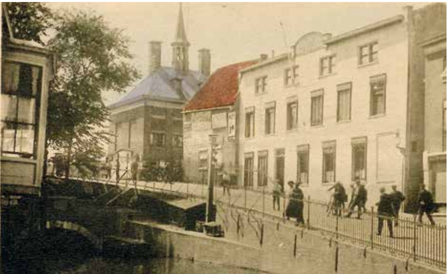
De Wip met het Zeemanshuis na de verbouwing.

Ongeveer een jaar na de opening bericht het bestuur van de Vereeniging het volgende: 'Van het Tehuis wordt overvloedig gebruik gemaakt, meer zelfs dan men had kunnen verwachten. Al in het eerste jaar van zijn bestaan zijn er door onze zee- en visserlieden en ook door anderen die er van geprofiteerd hebben, ongeveer 10.000 bezoeken afgelegd en is er aan ongeveer 400 personen nachtverblijf bezorgd. Dagen komen er dat men niet aan alle bezoekers behoorlijk plaats kan geven en nachten breken er aan dat niet aan allen logies kan verleend worden. Indien dan ook, wat we zeker verwachten, dat het bezoek zal toenemen en er steeds meer om nachtverblijf gevraagd wordt, zal de Vereeniging op uitbreiding bedacht moeten zijn.'