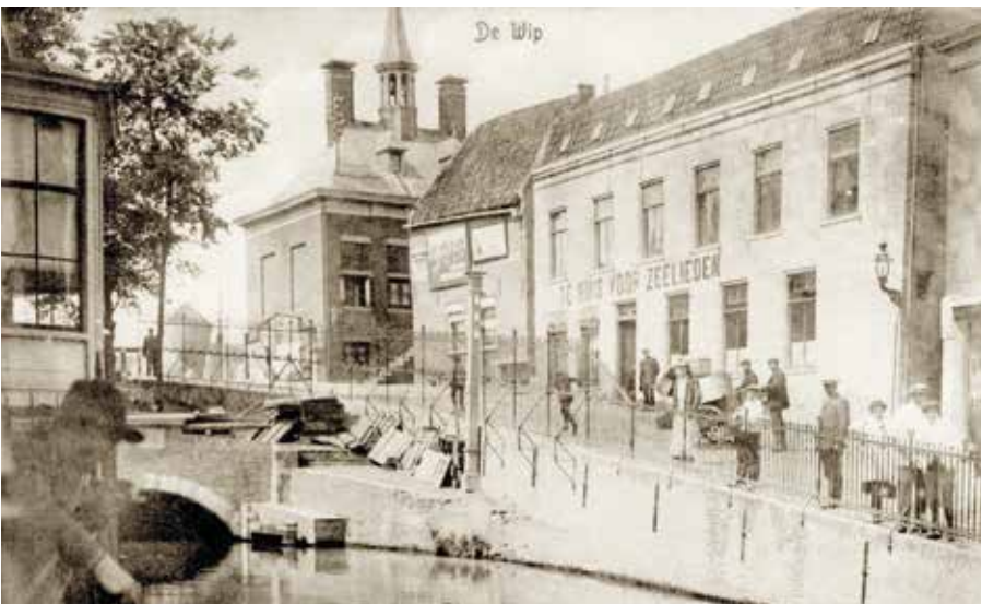
De Wip met het Zeemanshuis voor de verbouwing, (omstreeks 1902)

Het onverwachte gebeurde begin 1902 toen bleek dat het pand van huisschilder Willem Groenwegen (1856-1939) aan de Wip 1 (H13) te huur was. Op vrijdag 14 februari 1902 nam men tijdens een vergadering van de Vereeniging het besluit om het huis aan de Wip te huren voor f6,40 per week en in gereedheid te brengen voor een Tehuis 5 . De bouwplannen waren toch nog niet gereed en ook het kapitaal was nog niet aanwezig voor de nieuwbouw aan de Haven. Het bestuur zag het wel zitten: 'In mei hoopt men klaar te zijn.