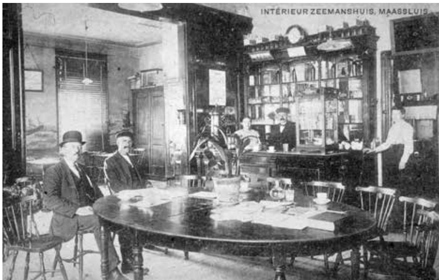
Interieur van het Zeemanshuis omstreeks 1919.