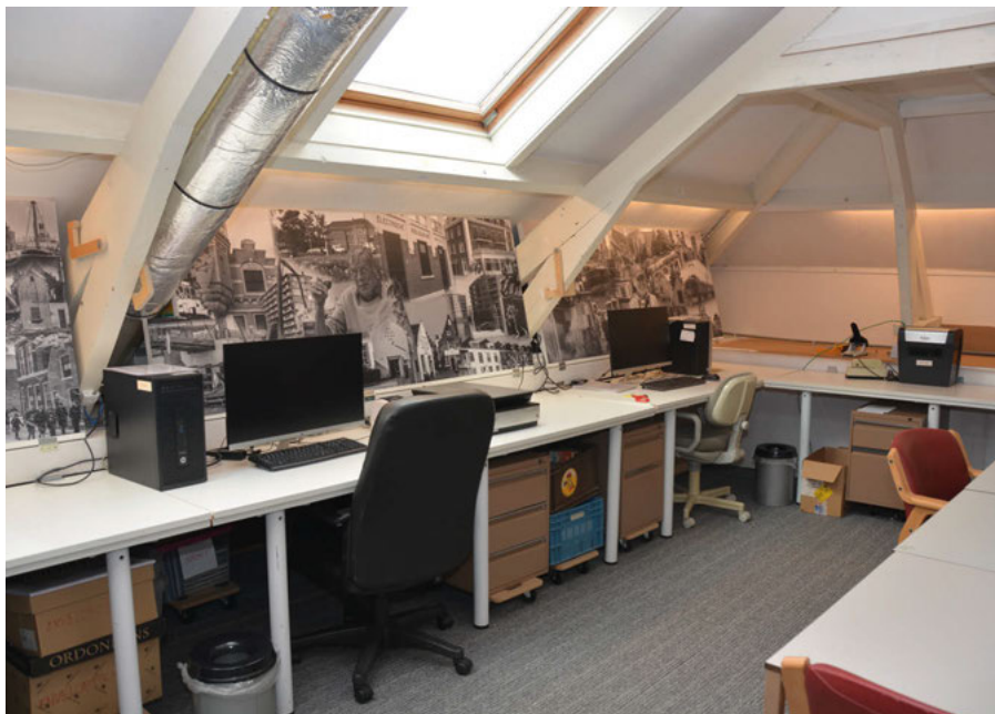
De werkplekken onder het schuine dak en twee van de vier fotopanelen.