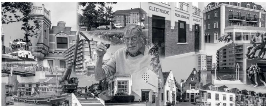
Het paneel van Jan Steehouwer en een compilatie van zijn foto's.