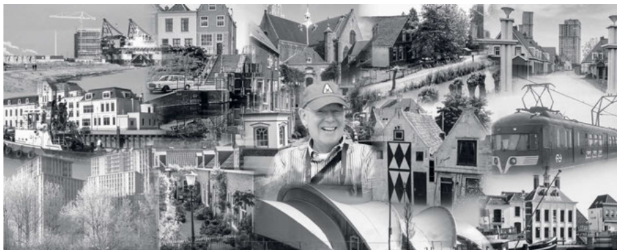
Het paneel van Theo Vols en een compilatie van zijn foto's.