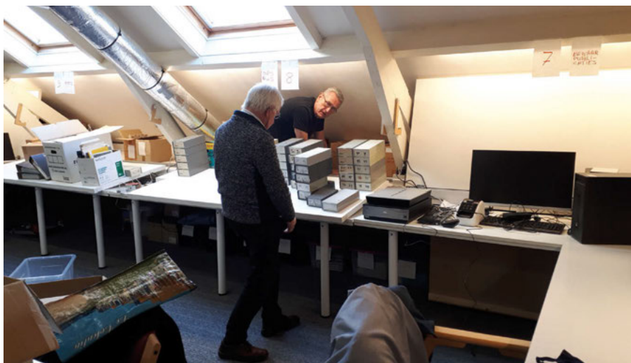
Verhuizen en opbergen van spullen van de HVM op de nieuwe zolder.

Toen de HVM in 2014 bij het museum introk, is de zolderruimte boven het kantoor van de conservator ontruimd door de museumvrijwilligers en aan de HVM ter beschikking gesteld. Het was een mooie ruimte, maar wel wat klein. Toch was het gelukt om er een aantal grote archiefkasten, vijf werkplekken en een vergadertafel met vier 'flexplekken' te creëren. Het grappige ging dat bij volledige bezetting de mannen om de beurt moesten ademen, dan ging het prima. Het was een fijne werkplek voor de vrijwilligers die aan de beeldbank, het archief en de bibliotheek werken. Maar het ontvangen van spontane bezoekers, wat juist zo leuk is aan een eigen ruimte, was nagenoeg onmogelijk.