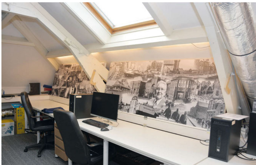
De fotopanelen van Stigter en Van de Stelt op de HVM-zolder.