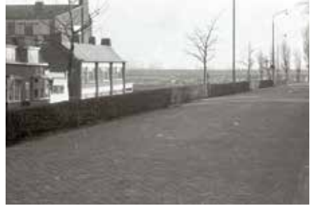
Zuiddijk met links beneden de Van der Horststraat en het Luxor theater.