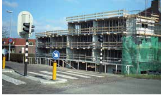
1999, nieuwbouw appartementen naast Luxor in volle gang.