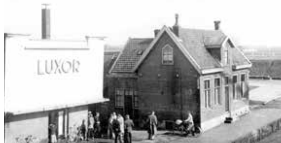
Luxorbioscoop omstreeks 1951. Daarnaast staat nog de melkcentrale.

Mensen die begin 20e eeuw in Maassluis een bioscoop wilden oprichten kregen meerdere malen het lid op de neus. Burgemeester en Wethouders en de gemeenteraad (toen voornamelijk A.R. en C.H.U) waren er op tegen. Dat was met het oog op 'zondig afdwalen van de Jeugd naar wereldse dingen en mogelijke versterking van de Zondagsrust'.