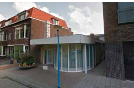
Luxortheater in 2020.

In de etalage van Herenkapsalon Wieger Beijert aan de Noordvliet 25 staat al jarenlang een oude filmprojector van de Luxor bioscoop.