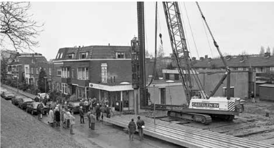
1998, eerste paal voor opnieuw nieuwbouw van winkels en appartementen naast Luxor.

De exploitanten/directieleden zullen zich vooral bemoeid hebben met de organisatie, filmselectie en filmaanschaf en andere organisatorische