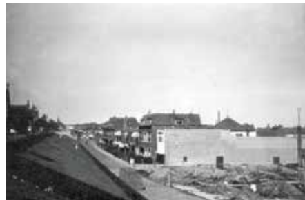
Naast het Luxor theater is men bezig met het bouwrijp maken van de grond voor het bouwen van een rij van vijf winkels met bovenwoningen. 1952

Tijdens een besloten feestje van buurtvereniging 'Kapelpolder' op 31 januari,