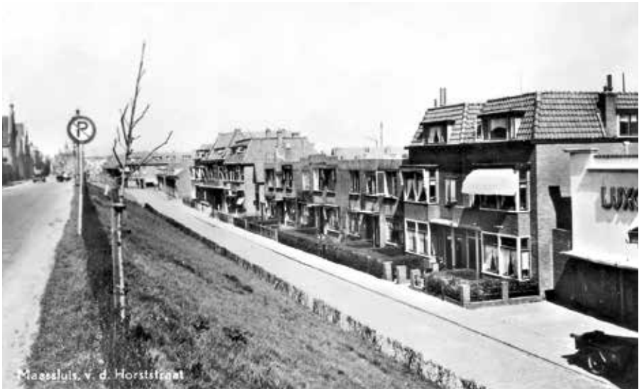
Van der Horststraat, rechts is Luxor.

Vanaf 1920 ging de Jokweg ter hoogte van de Patijnestraat over in de Van der Horststraat. De huizen aan de Van der Horststraat hebben tot 1941 op grondgebied van Maasland gestaan. Zo ook de bioscoop, die op grondgebied van het 'stichtelijke' Maassluis in die jaren nooit gebouwd had mogen worden. Maasland noemde dat deel 'de Verlengde Van der Horststraat'. Tijdens de bezetting in 1941 werd een grenswijziging doorgevoerd waardoor de gehele Van der Horststraat grondgebied van Maassluis werd.