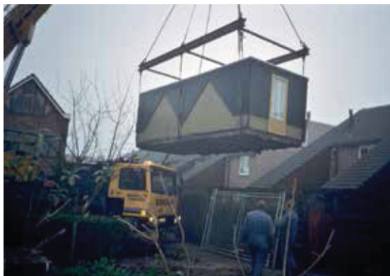
Het verplaatsen van de schuurtjes was noodzakelijk.

De schadebedragen blijken later behoorlijk uiteen te lopen, van een paar honderd gulden tot 5.000 gulden. Het ging dan vooral om schade aan de tuintjes. Wie voor de sanering een fraaie aangelegde tuin had, kreeg een groter schadebedrag.