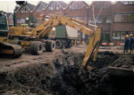
Een laag van één tot vier meter is afgegraven, variërend door de mate van vervuiling.

Op vrijdag 30 oktober 1987, dus 5½ jaar na de eerste klachten van de bewoners over vocht en stankoverlast, gaat de sanering van start. Milieugedeputeerde J. van der Vlist is speciaal naar Maassluis gekomen om het startsein te geven. In de komende maanden moet 8.000 kubieke meter verontreinigde grond worden afgegraven. Er is voor dit project 7,5 miljoen gulden beschikbaar gesteld.