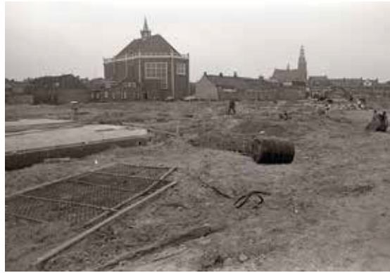
In 1986 kan de bouw van de wijk Verto-2 beginnen.

In augustus 1985 stelt ingenieursbureau Oranjewoud BV een saneringsplan op. Dit bureau wordt ook de sanering gegund tegen een veel te krappe aanneemsom van f 640.000,-. De reiniging van de vervuilde grond wordt gegund aan Ecotechniek BV.