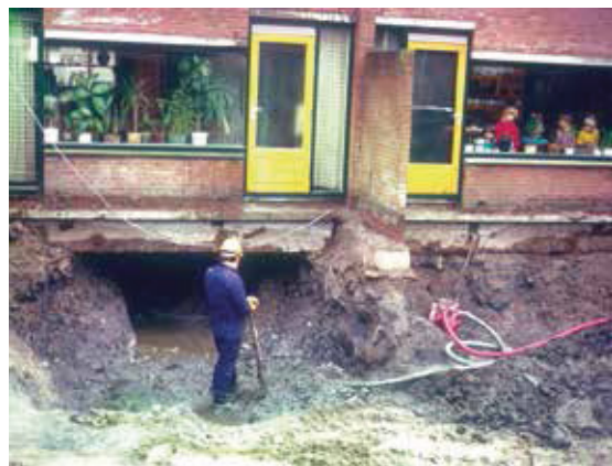
Stank en vochtproblemen maakten afgraving van de kruipruimtes noodzakelijk.

Het is wel zo langzamerhand duidelijk dat er een oplossing moet komen en dat wellicht aan sanering niet te ontkomen valt. Maar door geldgebrek en overheden die elkaar