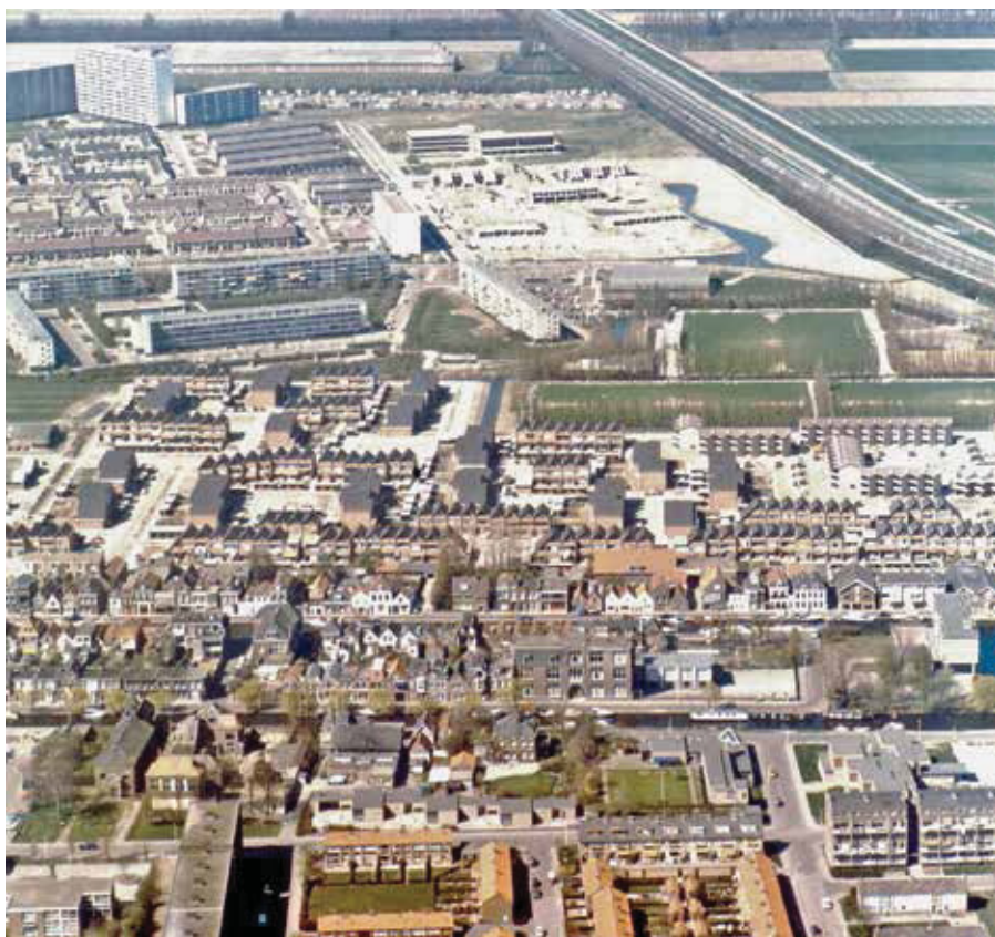
Circa 1977. Op de voorgrond de Zuidvliet en de Noordvliet. Daarachter, in het midden van de foto, de Vertowijk in aanbouw.

Tien dagen later zitten de verontruste bewoners in het gemeentehuis. Behalve de vraag over het drinkwater stellen ze aan wethouder Van der Knaap ook de vraag waarom er op het open terrein van Verto-2 eerder met het onderzoek van de bodem is begonnen. Het blijkt dat de gemeente Maassluis er primair belang bij had om het Verto-2-terrein bebouwd te krijgen. Er liep al een