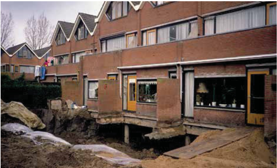
'Het afgraven kan tot overlast leiden', was het bericht aan de bewoners na vijf jaar onderzoek.

De bewonerscommissie is erin geslaagd om geld van de gemeente te krijgen om zich te laten bijstaan door deskundigen. Zij nemen het adviesbureau De Staat in de arm.