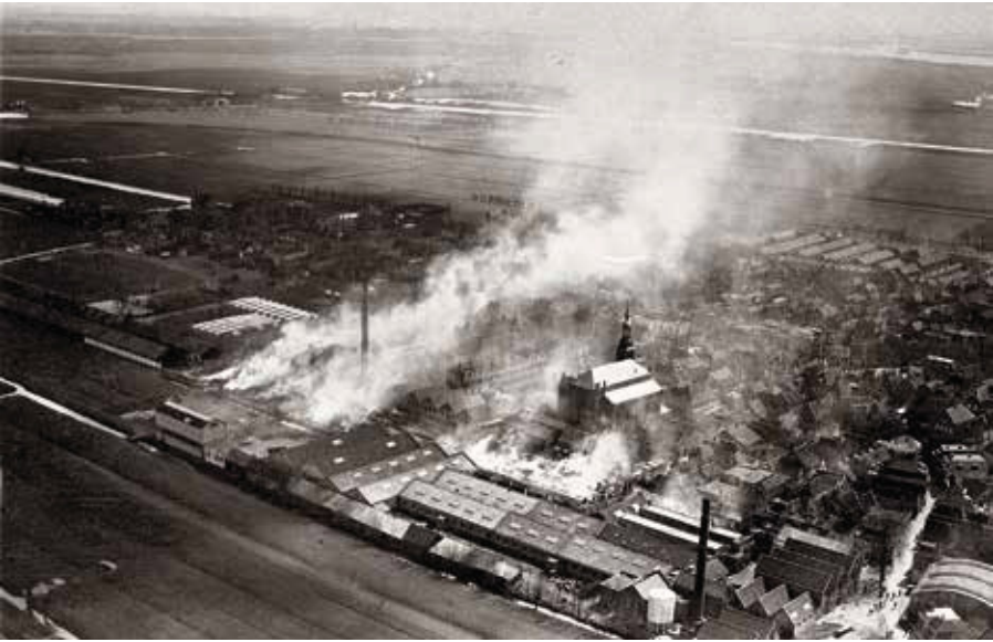
Brand in de touwfabriek, 1929.

Aanvankelijk ging het niet allemaal van een leien dakje. Een van de grootste dieptepunten waarmee de touwfabriek werd geconfronteerd, was een felle brand in 1929. Deze trof een vitaal gedeelte van het bedrijf. Nadat de schade was hersteld werd het werk weer even ijverig als daarvoor ter hand genomen. Enkele jaren later bood de touwfabriek, ook wel 'de Baan' genoemd, aan 800 tot 900 mensen werk.