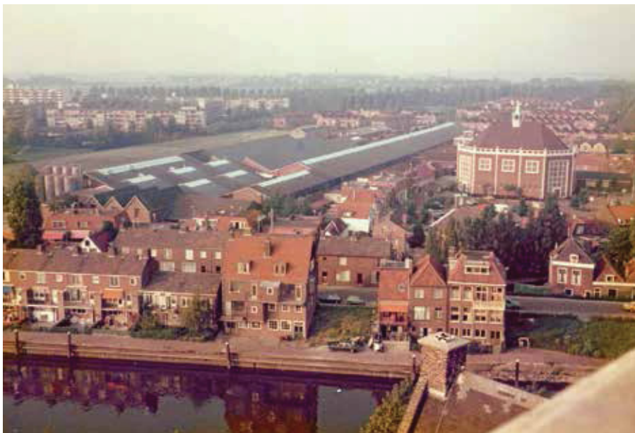
Zicht vanaf Grote Kerk op de Noorddijk en Vereenigde Touwfabrieken met daarachter de eerste nieuwbouw Vertowijk. Circa 1980.

In november 1974 wordt de eerste paal voor het Verto-1-complex geslagen. Staatssecretaris Jan Schaefer is hiervoor zelfs uit Den Haag gekomen.