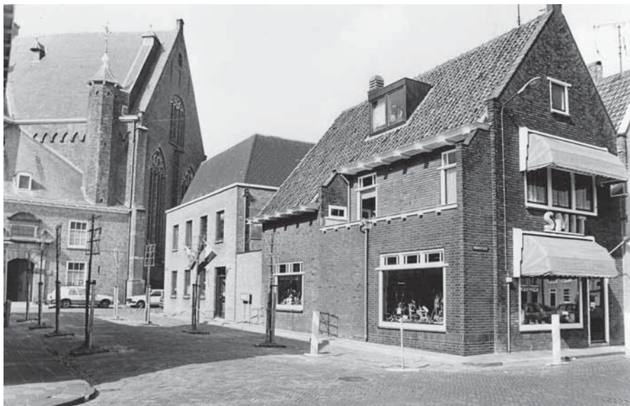
Het pand Marnixkade 5, op de hoek met de Kerkstraat, na de verbouwing. Het pand van de voormalige smederij in de Kerkstraat is vervangen door nieuwbouw.