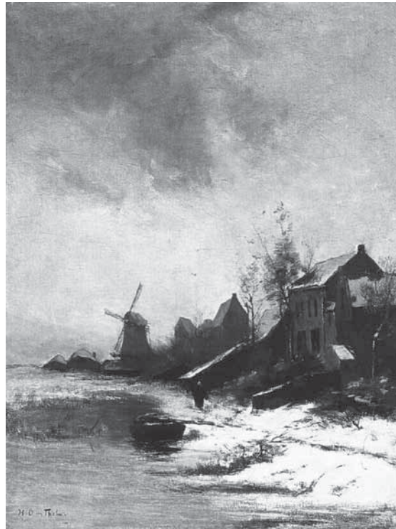
Schilderij van De Zon. (door W.B. Tholen)

Echtgenote Maartje Stigter en de dochters dreven het café en logement. Een knecht reed op verzoek met een koets uit de stalhouderij, welk gebouw rechts tegen het grote pand aanleunde. Er was een theekoepel met uitzicht over het water en binnen waren een biljart en vergaderzalen. Het café werd ook gebruikt voor openbare verkopen, zoals we in een dagbladadvertentie uit 1867 lezen: een goed onderhouden overdekte Westlandse schuit van 21 tonnen werd door notaris Reeser in Logement De Zon openbaar verkocht. Leendert Pieter Buitelaar verdiende zijn geld alle zeven dagen van de week, iets wat te Maassluis niet iedereen hem durfde nadoen. Zondag was rustdag. Maar de koeien moesten op zondag gemolken worden en het koetsje reed op zondagen niet voor niets als de dominee gehaald en gebracht moest worden.