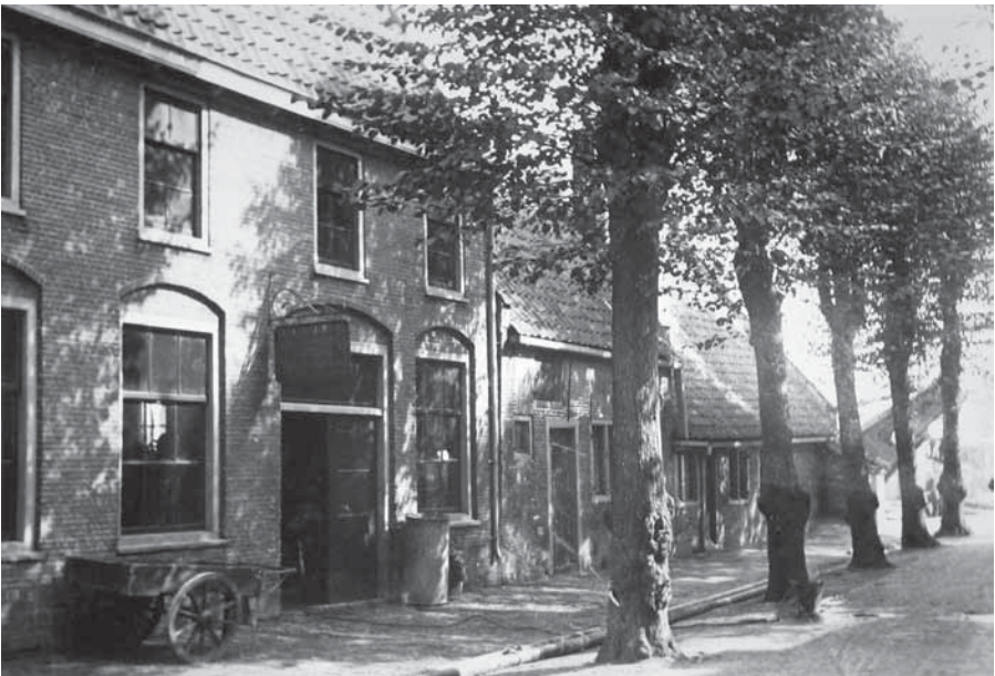
Links de oude smederij, Kerkstraat 2.

De geschiedenis van het bedrijf begint in het jaar 1900 met Wolter Smit. Omdat het verhaal over vijf generaties handelt die allen Wolter of Henk heten en soms Piet, geven we de opeenvolgende generaties aan met een klein cijfertje. Zodat u niet in verwarring raakt.