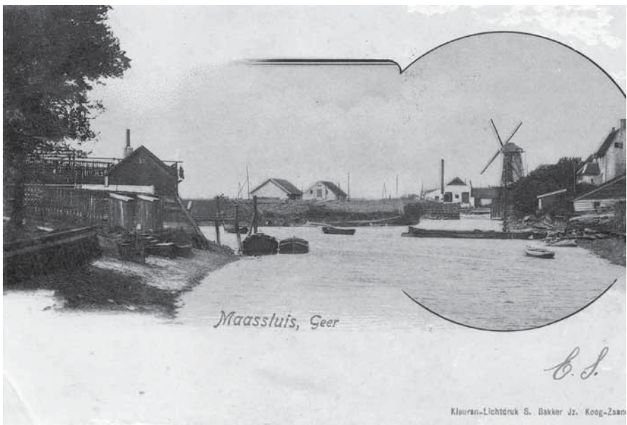
Aansichtkaart van de Noordgeer met café De Zon en molen De Arend. In het midden de schuren op het land van Buitelaar in de Kapelpolder.

De onteigening zal hen nog welgestelder gemaakt hebben. Trots werd in de familie verteld dat mijn overgrootvader voor de onteigening begin