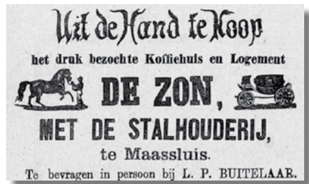
Verkoop van Koffiehuis en Logement De Zon.

Op soortgelijke wijze zijn in de loop der tijd in ons taalgebied door samen-trekking van laatste lettergrepen(-ander werd -er of -aar) eveneens ontstaan: Brabander werd Braber elkander werd elkaar Hollander werd Hollaar