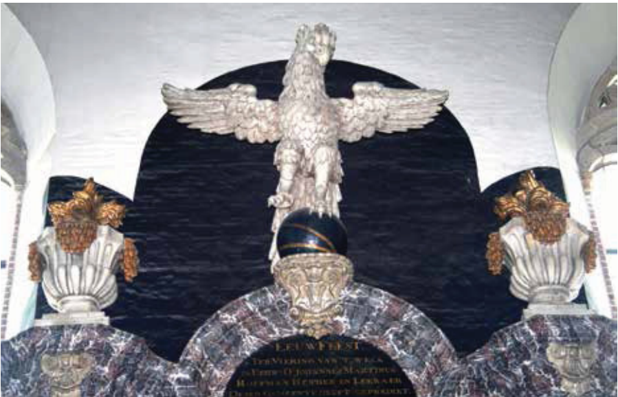
De Fenix en de brandende vazen op het eeuwfeestbord.