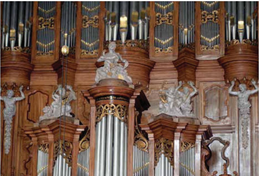
In het midden vrouwe Fortuna, daarnaast engeltjes met wapenschilden. Atlanten dragen de vier kolommen van het orgel.

Mijn verhaal wordt eentonig, maar ook die cherubijntjes of cherubs zijn van heidense komaf. Weliswaar komen cherubs veelvuldig in de Bijbel voor (zo bewaken zij in het boek Genesis (4, 26) de weg naar de boom des levens in de Hof van Eden en zijn zij zelfs aangebracht op de Ark van het Verbond