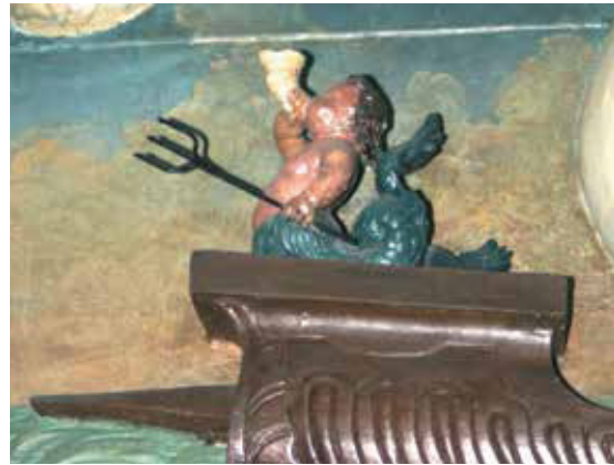
Zeegod Triton blaast op zijn kinkhoorn.