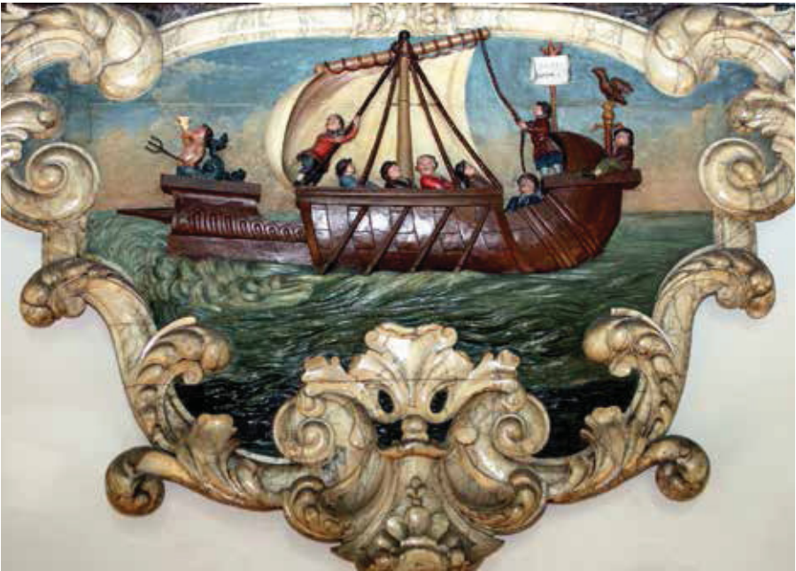
Schip des levens onderaan het eeuwfeestbord.

Wonderlijk dat ds. Hoffmann het heeft over 'de godheid', want dat is toch niet anders dan een Romeins heidens begrip? De Latijnse benaming voor God is 'Deus' en Hoffmann had die benaming prima kunnen gebruiken. Waarom die rare benaming 'godheid'?