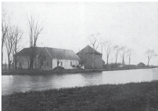
Vliethoff in 1920, gezien vanaf de Karperhoeve.

De foto uit 1920 laat naast het hoofdgebouw, met boenhok en stal, de in 1910 gebouwde schuur zien. Verder zien we een hooiberg aan de vlietkant, rechts daarvan de achterste hoek van een schuur achter de stal, de oude schuur. Deze oude schuur diende voor het stallen van het jongvee. Verder is het begin van het haventje voor de mestschuit aan de vlietkant te zien en nog verder achter de boerderij het schuurtje van Napoleon. Tot slot is op de foto te zien dat het hoofdgebouw toen nog geen voordeur had. Tevens ontbreken de drie in 1939 geplaatste ramen boven de woonkamer toen daar twee slaapkamers zijn gemaakt (zie de foto van de Vliethoff uit 1970).