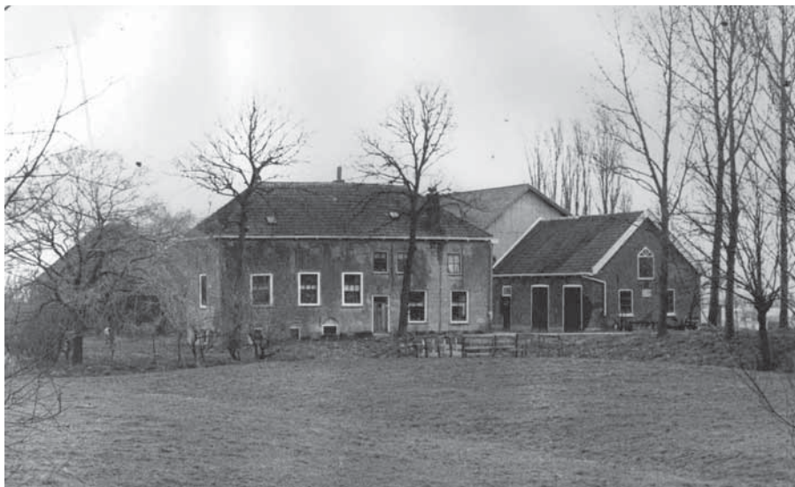
Vliethoff gefotografeerd vanaf de kade langs de Gaag (vliet) voor de boerderij in 1974.

Aan het eind van de oorlog verkocht men naast melk ook aardappelen aan de bewoners van Maasluis en omliggende plaatsen. Eind 1944 kwam de Foppenpolder blank te staan door gebrek aan brandstof voor het poldergemaal. Na het begin van de spoorwegstaking zaten mensen van het spoor op de boerderij ondergedoken.