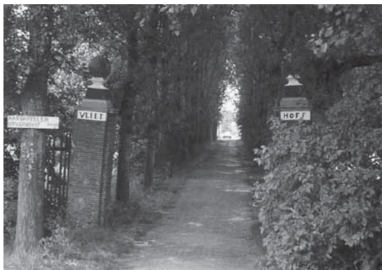
1974, het toegangshek met populierenlaan uit 1947.

Kort na 1800 blijkt de boerderij met land in het bezit van Jan Klapwijk en Elizabeth van Zanten, getrouwd op 6 mei 1804 te Maasland in gemeenschap van goederen. Elizabeth overleed op 7 maart 1817. Zij liet 5 minderjarige kinderen na. De boedelbeschrijving, opgemaakt na haar overlijden, noemt een woning, schuur, bijhuis, bargaen, tuin, boomgaarden (aangeduid als Vliethoeff) en 33 morgen en 167 roeden land waarvan 10 morgen en 4 hond in de Foppenpolder, 14 morgen en 177 roeden in de Aalkeetbinnenpolder en 7 (of 9?) morgen plus 250 roeden hooiland in de Aalkeetbuitenpolder strekkende van Zuidbuurt tot Rijskade. Daarnaast wordt nog 1 stuk land (ruim 4 morgen) in de Sluispolder en 2 stukken land in De Lier vermeld.