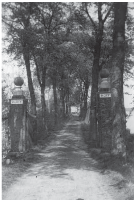
Het toegangshek met iepenlaan (hier in 1940) dateert uit de 18e eeuw.

De oudst bekende kaart van het gebied aan weerszijden van de huidige Korte Buurt en Zuidbuurt dateert uit 1531. Op deze kaart staan veel boerderijen aangegeven op plaatsen waar nu boerderijen van latere datum staan. Dit betreft ook Vliethoff. Volgens verhalen van mijn vader heeft men ruim een meter onder de boerderij Vliethoff de overblijfselen van een oudere boerderij gevonden, wat zou kloppen met bovenstaande. De met stenen gebouwde boerderij Vliethoff, waarop onze familie gewoond heeft, is waarschijnlijk omstreeks 1640 gebouwd. Dat zou inhouden dat deze boerderij ruim 70 jaar vóór de (nu nog) bestaande Karperhoeve aan de overkant van de Boonervliet gebouwd is. En ook dat hij iets ouder was dan boerderij De Ridderhof (gebouwd omstreeks 1658) aan de overkant van de 'Kortebuurt'.