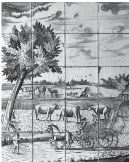
Tegeltabelau boven het waterfornuis in de oude boerderij.

Naast het voorhuis werd in 1910 aan de vlietkant een extra schuur gebouwd met ruimte voor stalling van werktuigen (later de trekker en de auto), een stal voor twee paarden, een hok voor kalveren en daarboven een hooizolder. In de muur van deze schuur was een gedenkplaat met de tekst 'de eerste steen is gelegd door de diakonie Herv. Gemeente, J.C. van der Sar, D. Oosterlee,