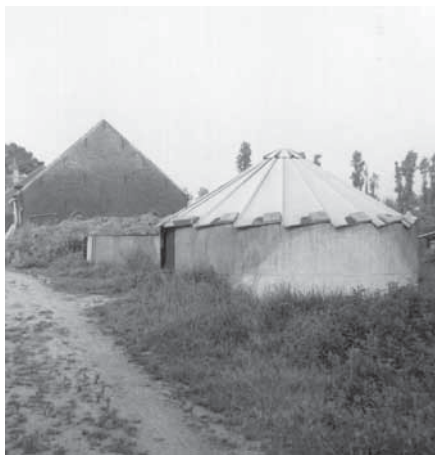
De twee in 1935 gebouwde silo's met daarachter de mestvaalt en de 'oude' schuur. Op de voorste silo ligt een dak tegen de regen (1965).

Aan het eind van het erf waren in 1935 twee silo's gebouwd, elk met een inhoud van 60 m 3 . De hooiberg werd in 1939 vervangen door een grote schuur, die aan een kant open was. Voor deze schuur zat een grote luifel van circa 3,5 m breed en 4,5 m boven de grond zodat wagens vol met hooi of graan eronder geparkeerd konden worden. Het haventje achter de nieuwe schuur werd gedempt. Overigens stond het haventje nog steeds keurig ingetekend op de officiële kaarten voor het aanleggen van de waterleiding in de Kortebuurt en Zuidbuurt in 1966.